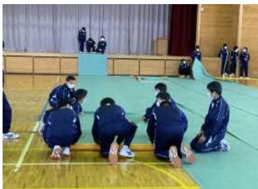
4/7 入学式の後片付けの様子 一人ひとりが自主的に働いてあっという間に 片付けが終わりました。成長した姿に感動！