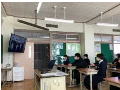
4/6 新しいクラスでの出会い 始業式は校内放送でした。